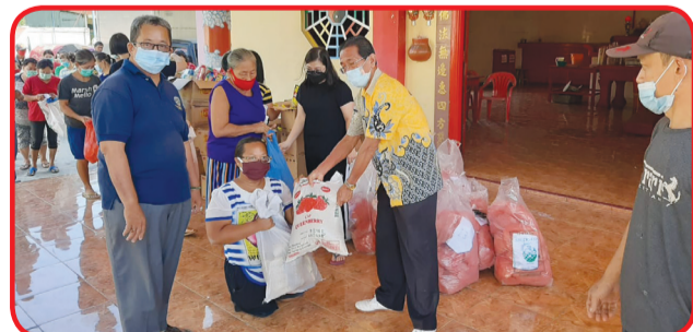
VIHARA DA SHENG : Suasana pembagian paket sembako di Vihara Da Sheng Perbaungan.