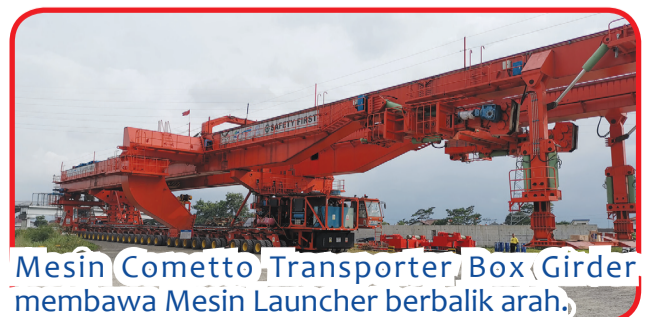
Mesin Cometto Transporter Box Girder membawa Mesin Launcher berbalik arah.