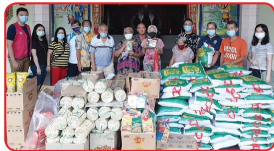
YUAN SHUAI: Rotary Club Medan Deli membagikan paket sembako di Vihara Yuan Shuai Titi Kuning.