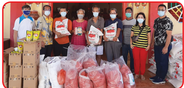
SIMBOLIS : Rotary Club Medan Deli secara simbolis membagikan paket sembako di Vihara Da Sheng Perbaungan.