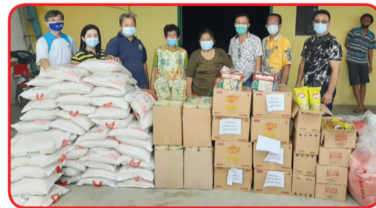
SIMBOLIS: Rotary Club Medan Deli secara simbolis membagikan paket sembako di Desa PON.