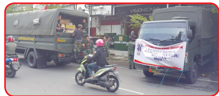
Bantuan didistribusikan menggunakan kendaraan TNI ke Majene – Mamuju.