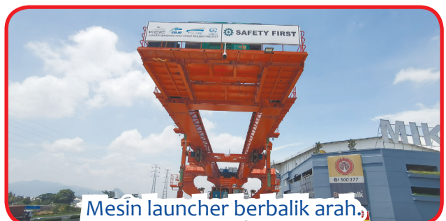
Mesin launcher berbalik arah.

Selain itu juga memperoleh pengakuan dari Kementerian Pekerjaan Umum Indonesia. • idn/din