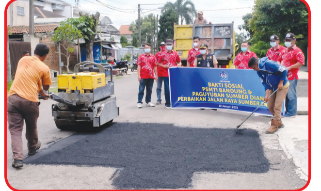
PSMTI Jabar dan perwakilan Paguyuban Sumber Dian memeriksa proses perbaikan jalan.

makna ini. Semoga Tuhan membalas kebaikan para donatur dengan melimpahkan kesehatan dan kebahagiaan," ujarnya. • idn/din