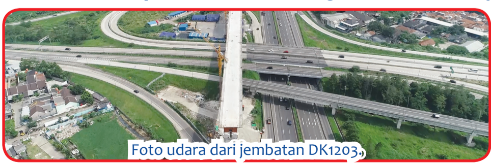
Foto udara dari jembatan DK1203.

Hingga Selasa (5/1) lalu, pemasangan box girder oleh lokasi produksi casting yard No.4 Kereta Cepat Jakarta Bandung