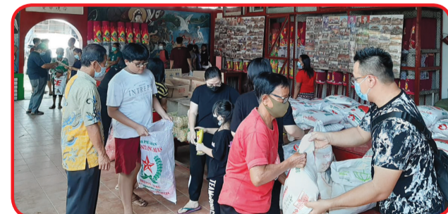
WU DANG SHAN MIAO : Suasana pembagian paket sembako di Wu Dang Shan Miao Sei Rampah.