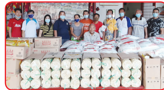
WU DANG SHAN MIAO: Rotary Club Medan Deli membagikan paket sembako di Wu Dang Shan Miao Sei Rampah.