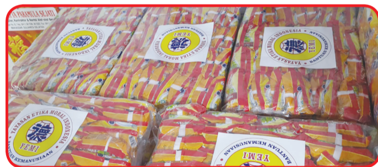
Bantuan yang didistribusikan untuk korban gempa di Majene – Mamuju.