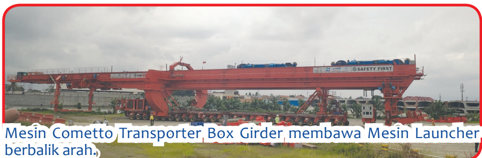
Mesin Cometto Transporter Box Girder membawa Mesin Launcher berbalik arah.