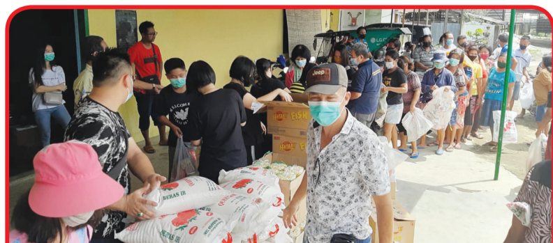
DESA PON: Suasana pembagian paket sembako di Desa PON.