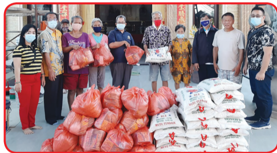
DHARMA SRADDHA: Rotary Club Medan Deli membagikan paket sembako di depan Vihara Dharma Sraddha Batang Kuis.