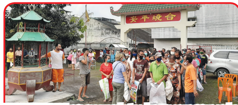
TITI KUNING: Warga masyarakat sedang menunggu pembagian paket sembako di kawasan Titi Kuning.

MEDAN (IM) - Anggota Rotary Club Medan Deli Minggu (17/1) lalu mengadakan bakti sosial di lima lokasi.